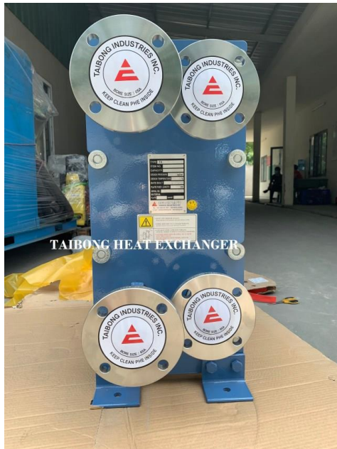
Trao đổi nhiệt tấm taibong hàn quốc tx3gd