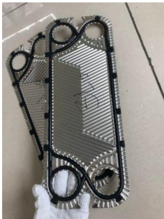
Thay gioăng tấm thiết bị trao đổi nhiệt KOSMG thực hiện bởi cleanphe