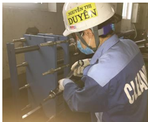
Thay gioăng tấm thiết bị trao đổi nhiệt HISAKA

Vật liệu gioăng: EPDM, NBR, HNBR, FKM, Viton.