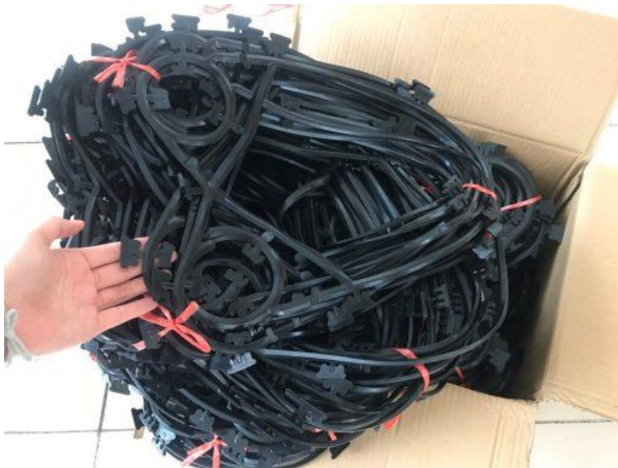
phụ tùng gioăng tấm trao đổi nhiệt có sẵn