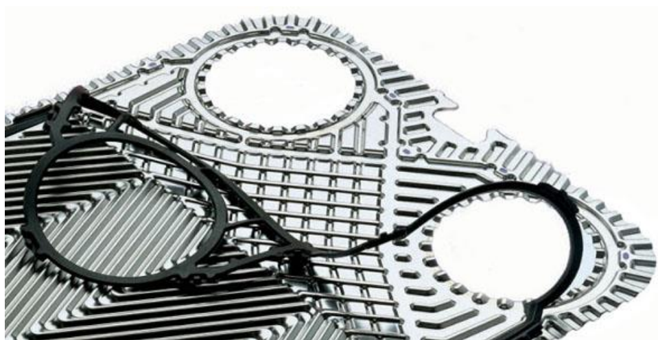
phụ tùng gioăng tấm trao đổi nhiệt có sẵn