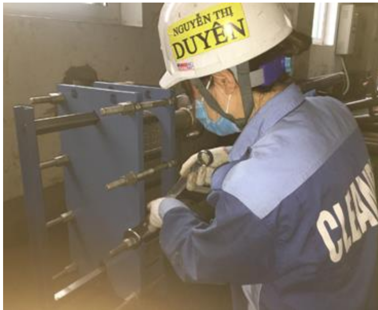
Thay gioăng tấm thiết bị trao đổi nhiệt DANFOSS

Vật liệu gioăng: EPDM, NBR, HNBR, FKM, Viton.