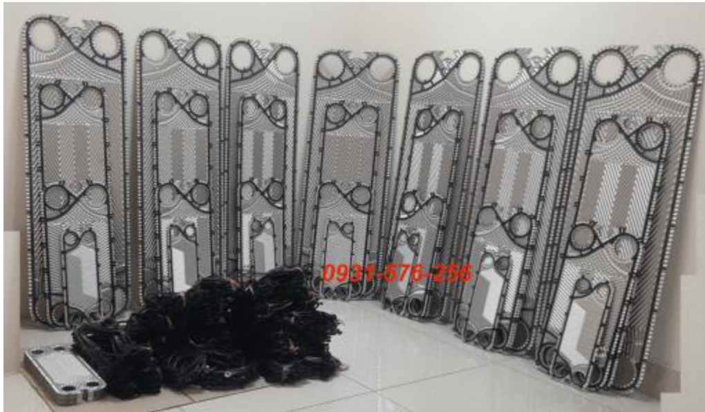
phụ tùng gioăng tấm trao đổi nhiệt có sẵn

Mua gioăng tấm và yêu cầu dịch vụ vệ sinh lắp đặt thiết bị trao đổi nhiệt Donga Engineering xin liên hệ