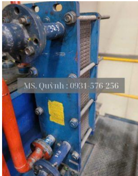
Hình ảnh Model DHE-030H của Dong-A sau khi đi vào sử dụng