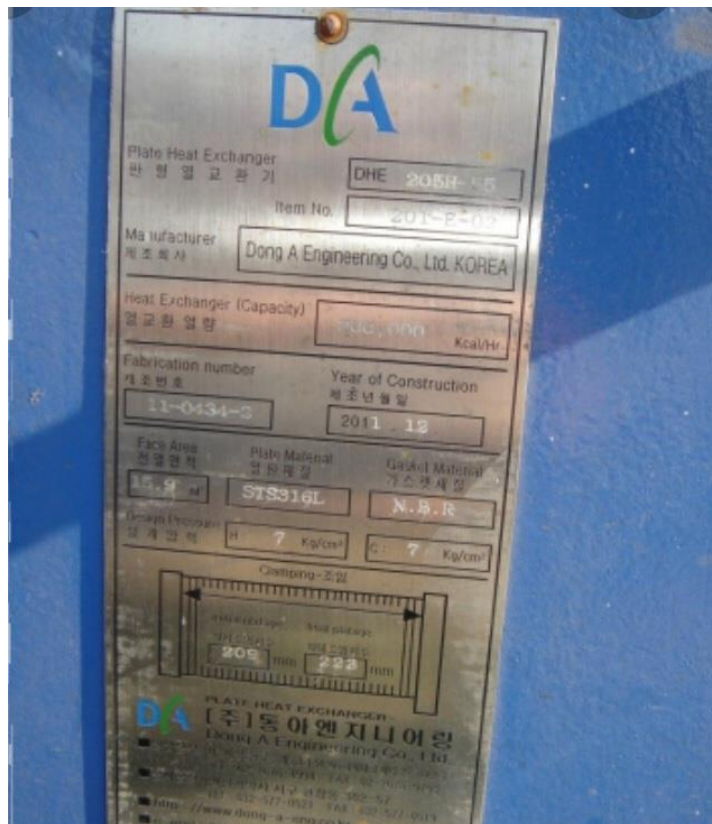
gasket gioăng tấm TĐN Dong A Engineering Korea