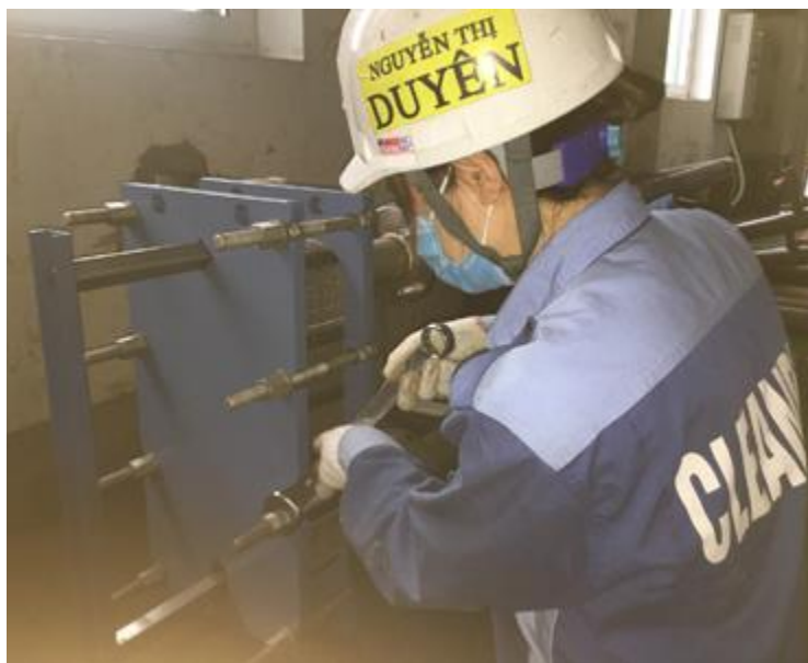
Thay gioăng tấm thiết bị trao đổi nhiệt DONG-A ENGINEERING plate heat exchanger