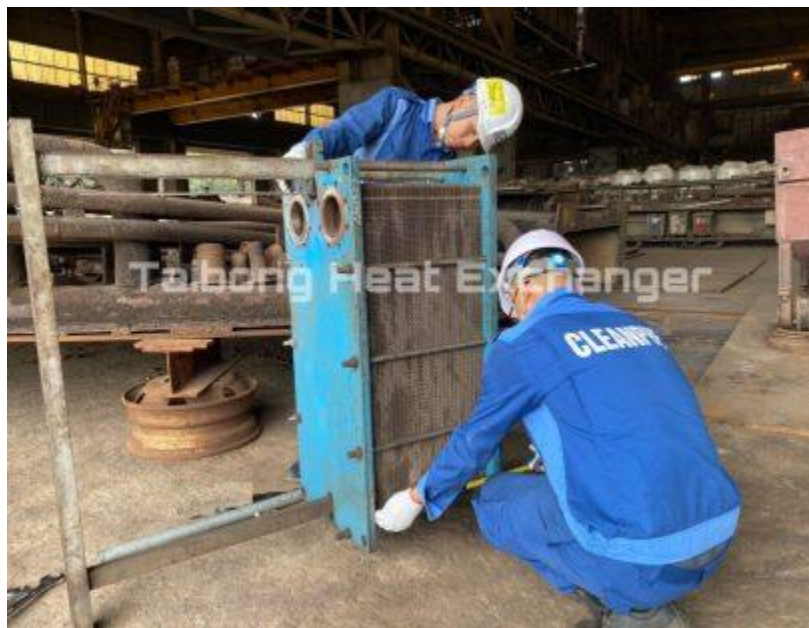
Thay gioăng tấm thiết bị trao đổi nhiệt DAEWON

Vật liệu gioăng: EPDM, NBR, HNBR, Hypalon, Butyl, FPM, FPM-G, Viton, Silicone, Neoprene.