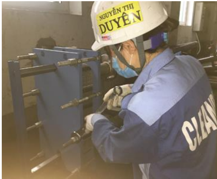
Thay gioăng tấm thiết bị trao đổi nhiệt CETETHERM