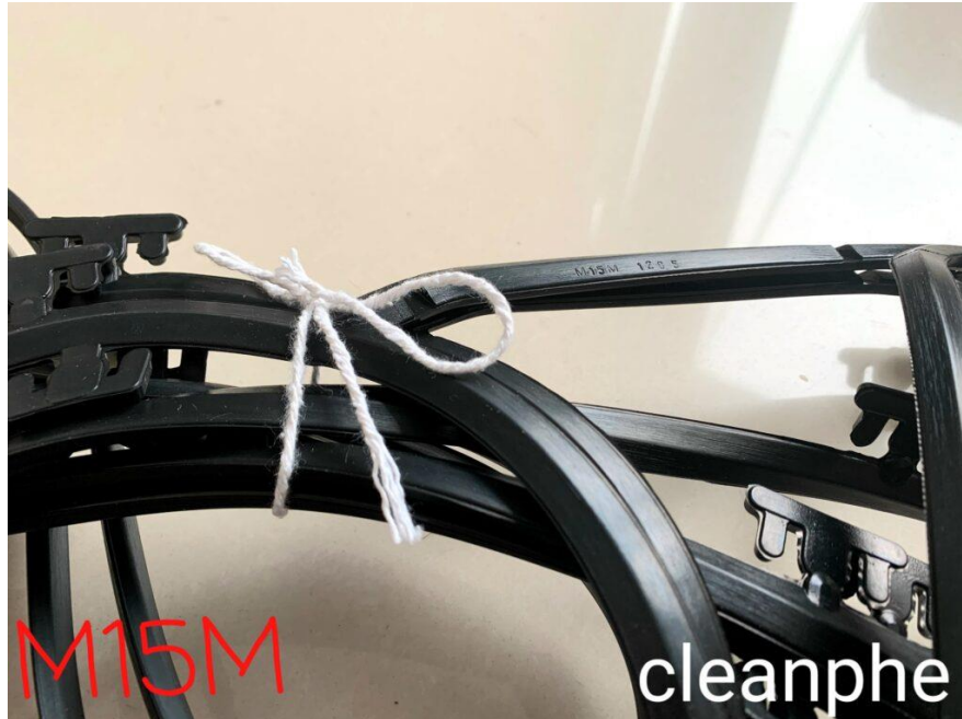
Loại M15M/ EPDM - Cleanphe

Mua gioăng / tấm và yêu cầu dịch vụ vệ sinh lắp đặt thiết bị trao đổi nhiệt xin liên hệ