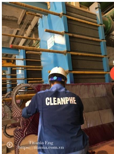
Thay gioăng tấm thiết bị trao đổi nhiệt ALFALAVAL

Vật liệu gioăng: EPDM, NBR, HNBR, FKM, Viton.