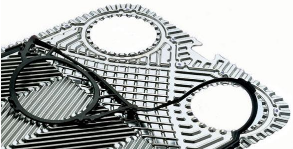
phụ tùng gioăng tấm trao đổi nhiệt có sẵn

Mua gioăng / tấm và yêu cầu dịch vụ vệ sinh lắp đặt thiết bị trao đổi nhiệt xin liên hệ